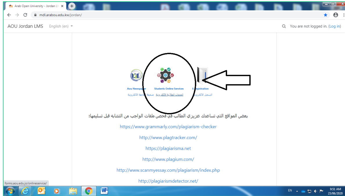
صورة رقم (1)

1. الدخول على موقع الخدمات الطلابية من خلال الرابط التالي http://forms.aou.edu.jo/onlineservice/ أو من خلال تطبيق الجامعة على الأجهزة الذكية، وكما هو مبين بصورة رقم (1).